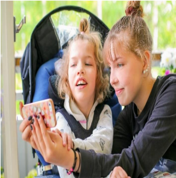
Ainon tarina 2019

Tavoitteena kansainvälisten kokemusten ja yhteistyön pohjalta tunnistaa ja tavoittaa alle 18-vuotiaiden nuorten hoivaajien sekä nuorten aikuisten hoivaajien (16-24-vuotiaat) ryhmät Suomessa.